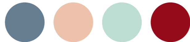
735 Djupet 751 Pinje 840 Isglass 754 Galon

Om du vill att kulörer ska sticka ut snarare än smälta in, kan du välja två komplementkulörer. Dessa förstärker varandra, och resultatet blir ett kontrastrikt men samspelt intryck. Exempel på nyanser som lyfter fram varandra är gröna och röda, blå och orangea, samt lila och gula toner. För ett lugnare intryck, välj en av dem som huvudkulör och den andra som accent.