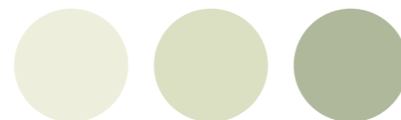
1 Kalk 945 Lagerblad 724 Pluton

Ett bra sätt att skapa variation i ett rum är att måla ytorna med olika nyanser som går ton-i-ton. Det är helt enkelt nyanser med bas i samma kulör men med olika mycket svärta i sig. Resultatet blir en harmonisk helhet där ytorna hänger ihop men ändå känns livfulla.